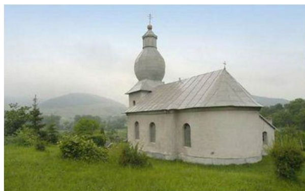
ĎURĎOŠ - Nanebovstúpenie Pána, 1781

Grécko-katolícky kostol Nanebovstúpenia Pána z roku 1781