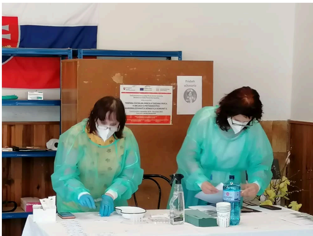
(Zrealizované očkovanie proti koronavírusu v obci pre obyvateľov )