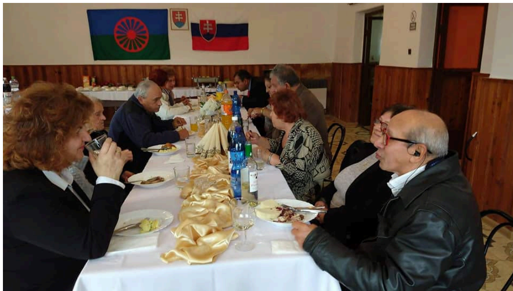
(Deň úcty k starším )